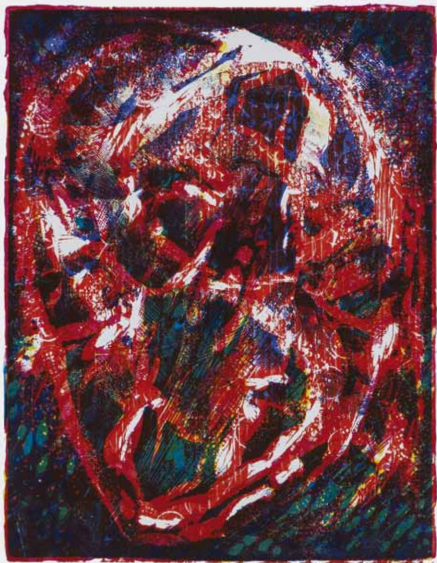
Ubaldo Monico «By / Corpo astrale / Ovulo rosso», 1973, xilografia a colori, 35 x 27 cm